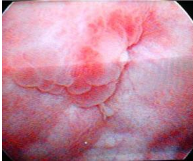
Fig. 1. Imagen cistoscópica.

Después de recibir tratamiento con antibióticos para eliminar la sepsis urinaria se realizó cistoscopia observándose edema y enrojecimiento de la mucosa vesical, gran cantidad de esfacelos de color blanquecino que dificultaron la realización del examen, además de imagen polipoidea de base sésil por detrás del trígono vesical ( Fig. 1 ).