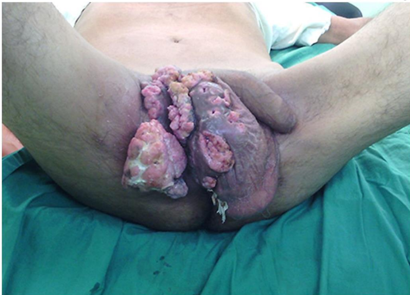
Fig 1: Condiloma gigante.

retroperitoneales ni lesiones tumorales en otros órganos.