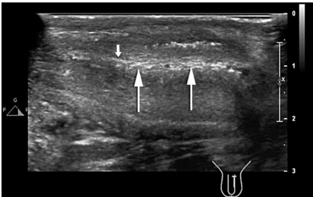
Fig. 2- Ultrasonido en corte longitudinal a lo largo de la cara ventral peneana muestra engrosamiento hiperecogénico del septum intercavernoso (flecha).