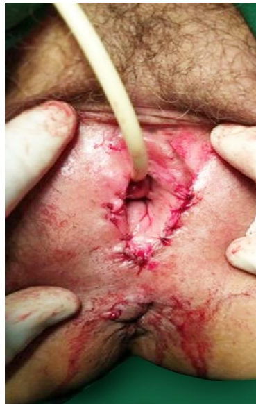
Fig. 3- Plastia vulvar.