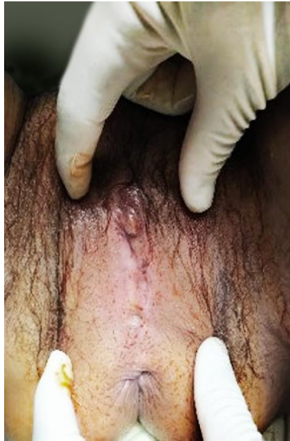
Fig. 1- Fusión de labios mayores.

Los estudios analíticos mostraron: hematocrito 0,38, glucemia 5,1 mmol/L, conteo de plaquetas 220 \times 10^9/L , leucograma con diferencial: 10 \times 10^9/L (polimorfonucleares: 0,60 %, linfocitos: 0,40 %) y creatinina: 70 \mu\text{mol/L} .